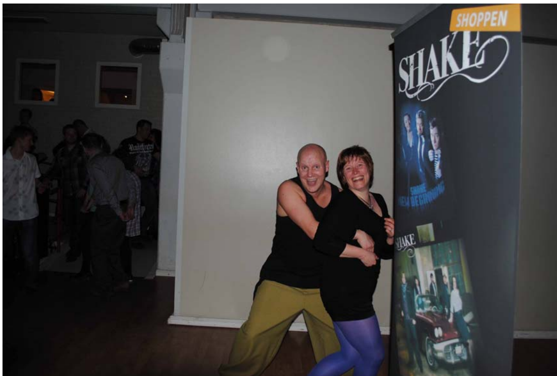
Fans på väg till logen...?!

Shake spelade i samband med Påskfesten. Tredje gången de var hos oss och för varje gång så har antalet dansare ökat. Nu satte de nytt rekord genom att locka 210 dansare.