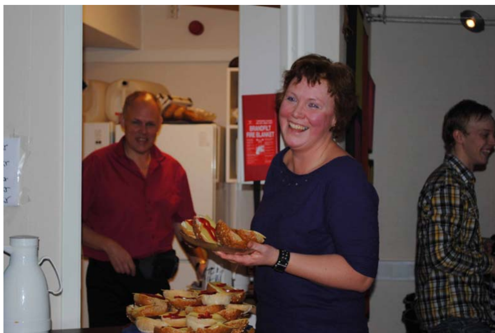
Festkommittén blir också hungrig!!