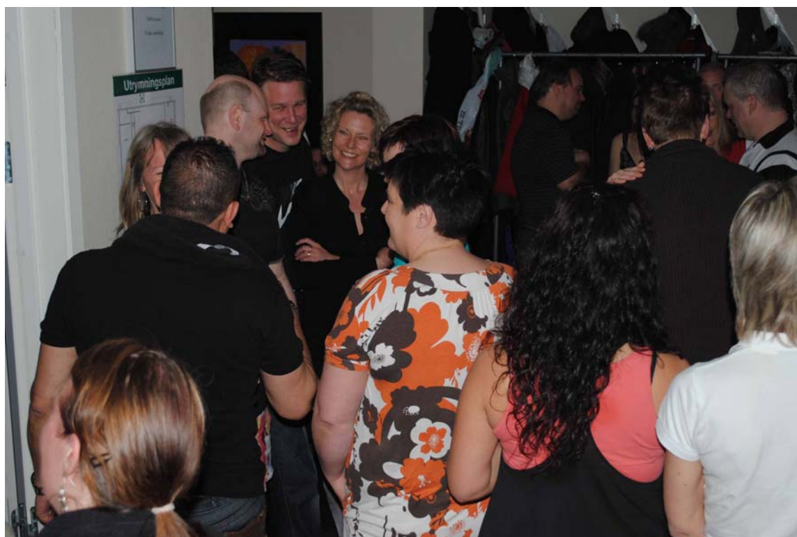
Mingel i cafeterian en vanlig påskfest!