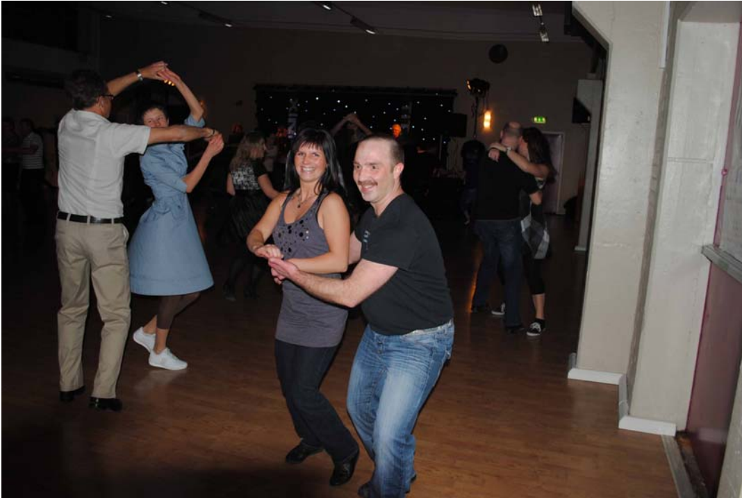
Dansglädje när Titanix spelade!

Mycket kända bandet, Titanix, gjorde sin andra spelning hos oss. 170 dansare passade på att dansa till detta succéband från Dansbandskampen.