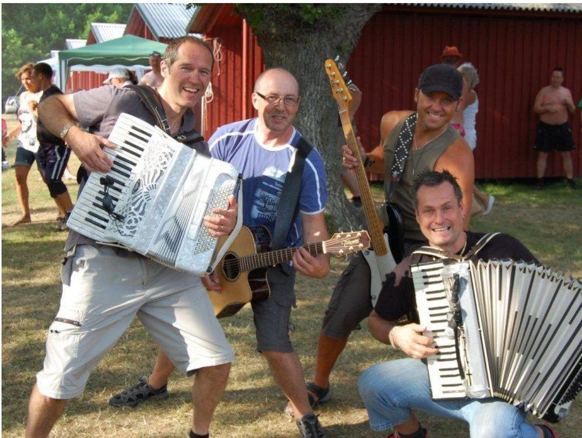
Jannez kommer till hallen 8:e oktober!