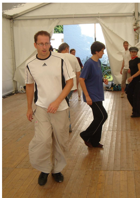
Lektion i ett av träningsstälten