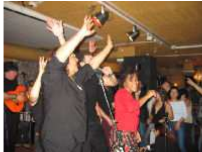
Bilder från Zeldaz i Växjö